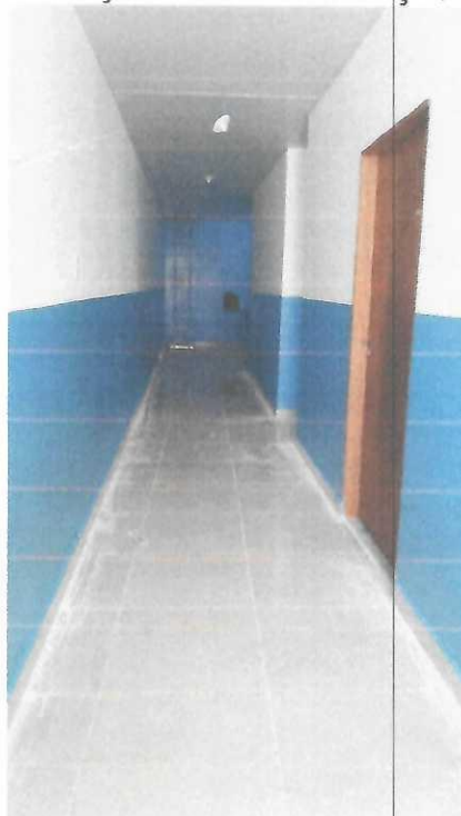
ESPAÇO INTERNO CIRCULAÇÃO

Avenida SN 21, Cidade Nova VI N° 18, Bairro Coqueiro, Ananindeua - PA CEP: 67.143-816 Email: engsesau@hotmail.com