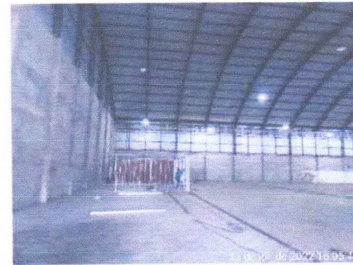
GALPÃO (INTERIOR 03)