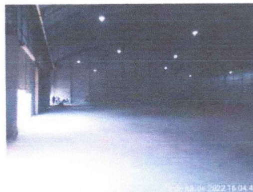
GALPÃO (INTERIOR 02)