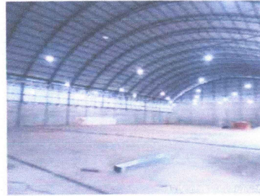
GALPÃO (INTERIOR 01)