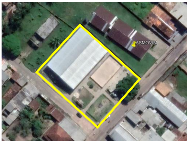
Ilustração 2 - Imagem aérea da Praça Asmovim.

A proposta está embasada primeiramente com projeto básico de arquitetura, orçamento analítico e cronograma físico-financeiro.