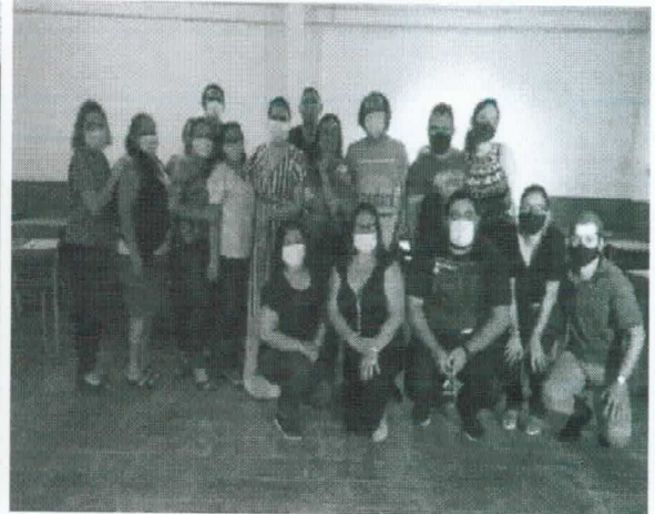
Palestra sobre Projetos de Vida na Escola Feliz Lusitânia: Icoaraci-Pa (2022)