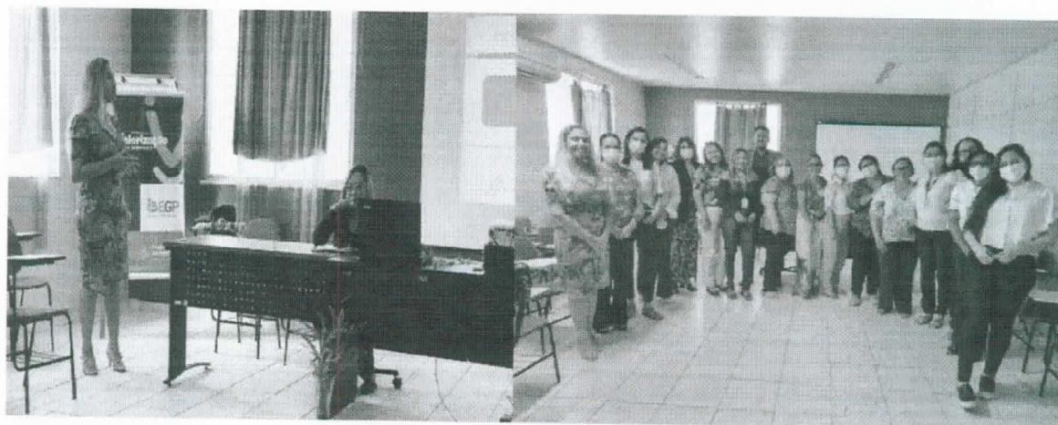
Palestra sobre os Impactos do Serviço de Acolhimento em Família Acolhedora (SAFA) no Desenvolvimento de Crianças de 0 a 6 anos – Apresentação do Projeto-Piloto de Implantação do SAFA em Belém/FUNPAPA (2022)