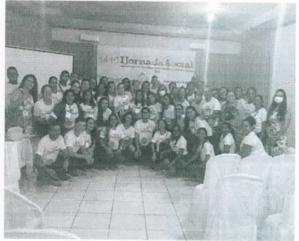
Palestra na I Jornada Social e Aurora do Pará (2022)