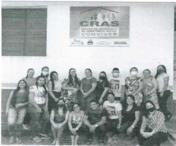
Capacitação com os profissionais da Assistência Social: Magalhães Barata-Pa (2021)