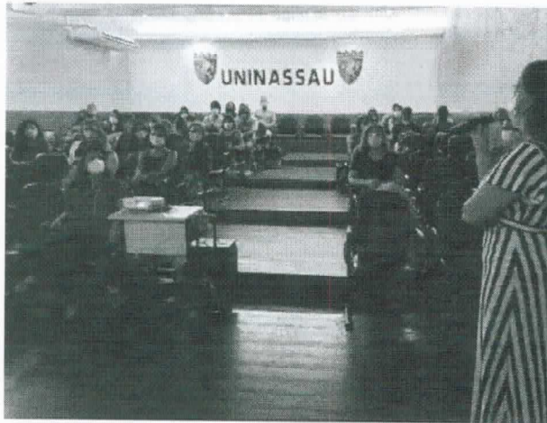
Palestra sobre Psicologia Social e Jurídica na UNINASSAU (2022)