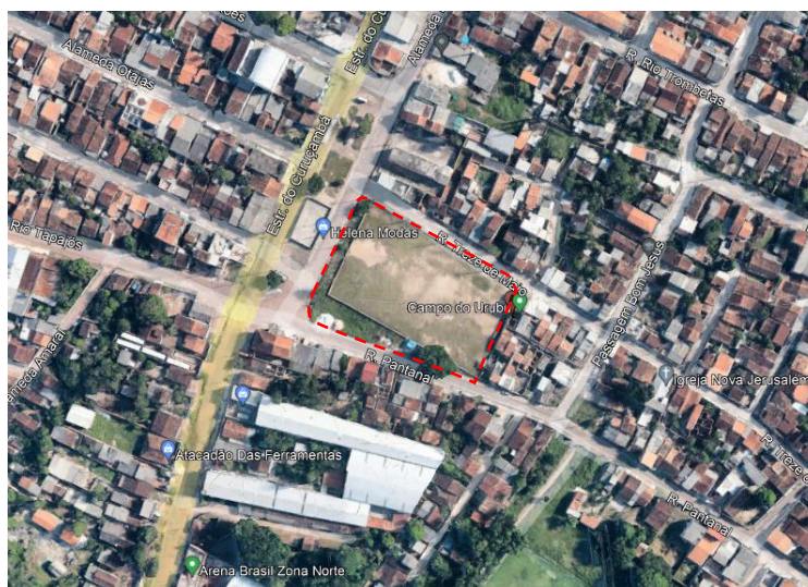
Ilustração 2 - Localização do Campo do Urubu

A proposta está embasada primeiramente com projeto básico de arquitetura, constante de implantação, planta baixa, orçamento analítico e cronograma físico-financeiro.