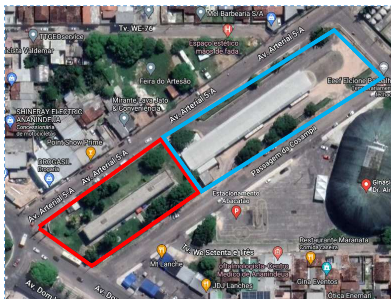
Ilustração 2 - Localização do Polo Criativo Digital e do Terminal de Integração da Cidade Nova

A proposta está embasada primeiramente com Projeto Básico de Arquitetura, constante de implantação, planta baixa, planta convencionada, layout, orçamento analítico e cronograma físico-financeiro.