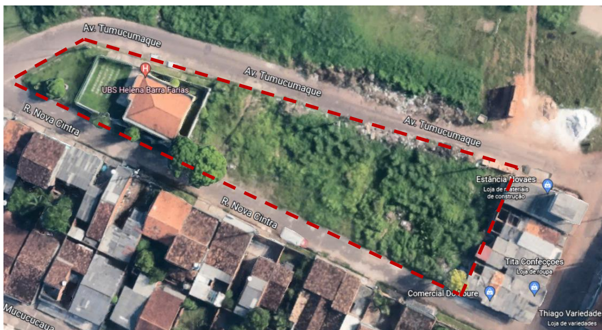
Ilustração 2 - Imagem aérea do terreno da Praça do Tumucumaque, Av. Tumucumaque.

A proposta está embasada primeiramente com projeto básico de arquitetura, constante de implantação, planta baixa, orçamento analítico e cronograma físico-financeiro.