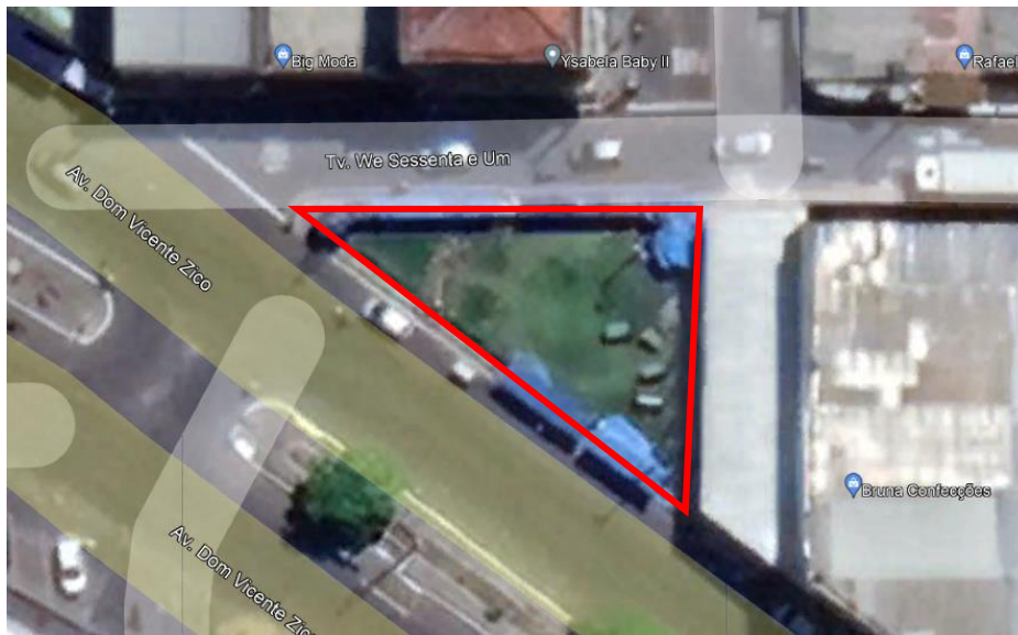
Ilustração 2 - Imagem aérea do futuro espaço do comércio popular.

A proposta está embasada primeiramente com projeto básico de arquitetura, orçamento analítico e cronograma físico-financeiro.