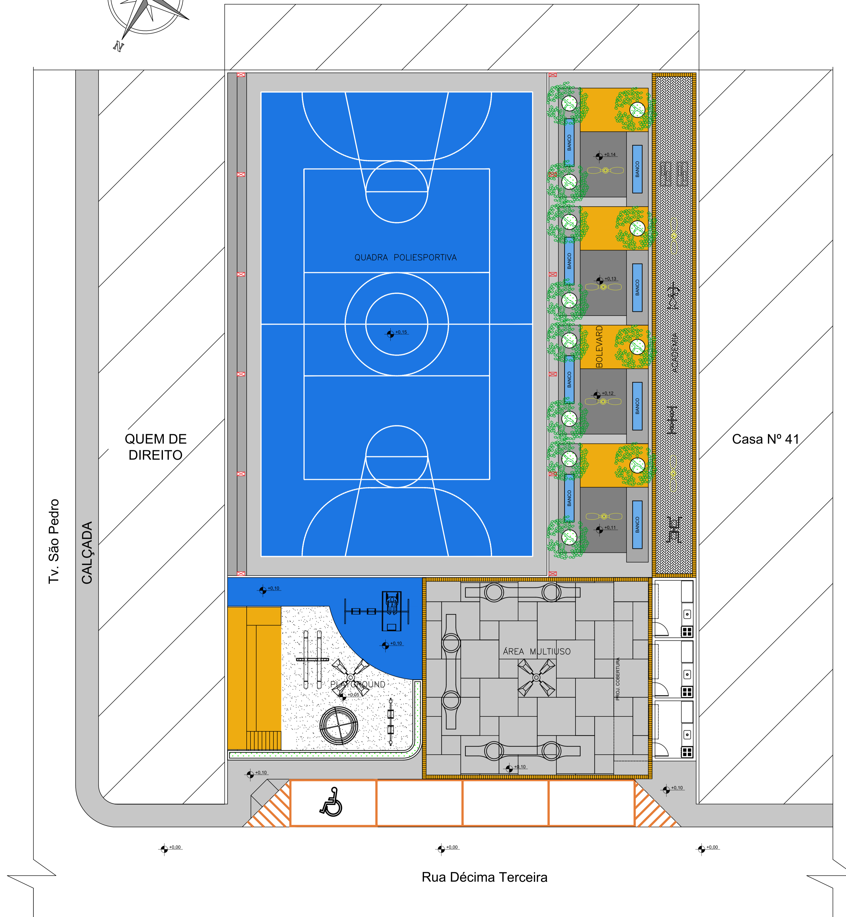
LAYOUT - PRAÇA MOARA 1:100