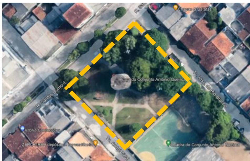
Ilustração 2 - Localização da Praça do Conjunto Antônio Queiroz

A proposta está embasada primeiramente com projeto básico de arquitetura, constante de implantação, planta baixa, orçamento analítico e cronograma físico-financeiro.