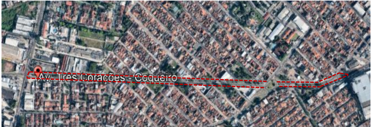
Ilustração 2 - Imagem aérea do Canteiro da Avenida 3 Corações.

A proposta está embasada primeiramente com projeto básico de arquitetura, constando de implantação, planta baixa, orçamento analítico e cronograma físico-financeiro.