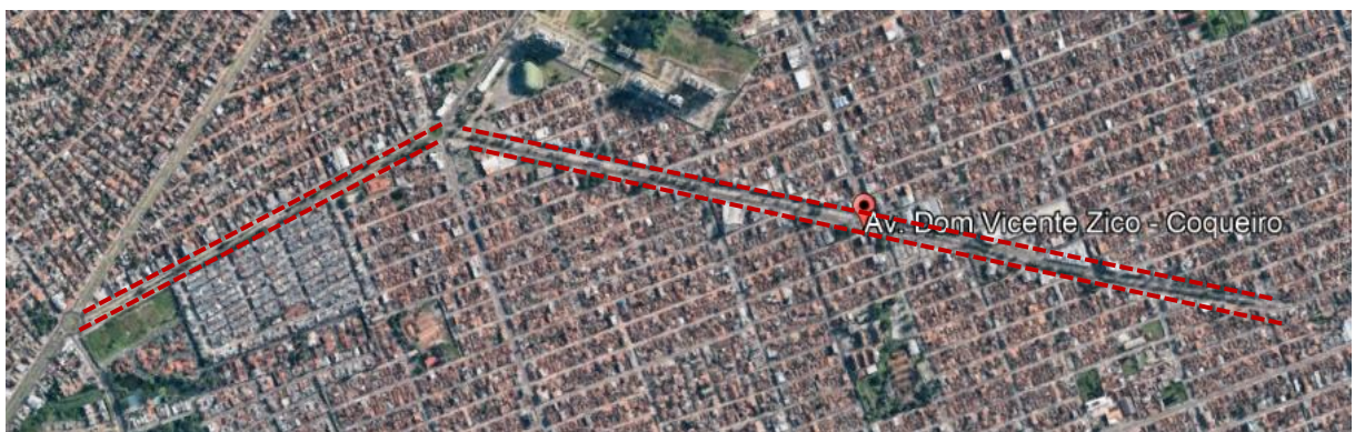
Ilustração 4 - Imagem aérea do Canteiro da Avenida Dom Vicente Zico.