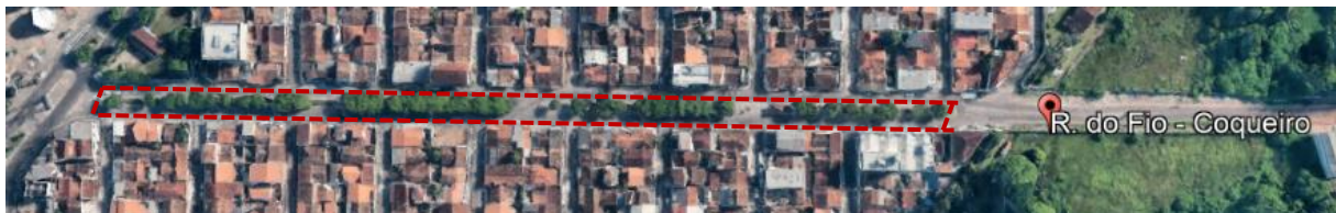
Ilustração 3 - Imagem aérea do Canteiro da Rua do Fio.