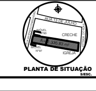
PLANTA DE SITUAÇÃO ESC.