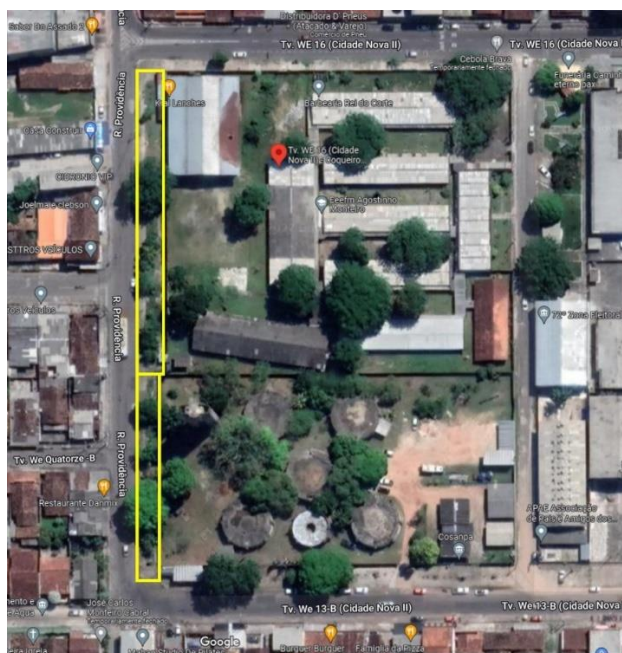
Ilustração 2 – Localização do espaço de alimentação

A proposta está embasada primeiramente com projeto básico de arquitetura, orçamento analítico e cronograma físico-financeiro.