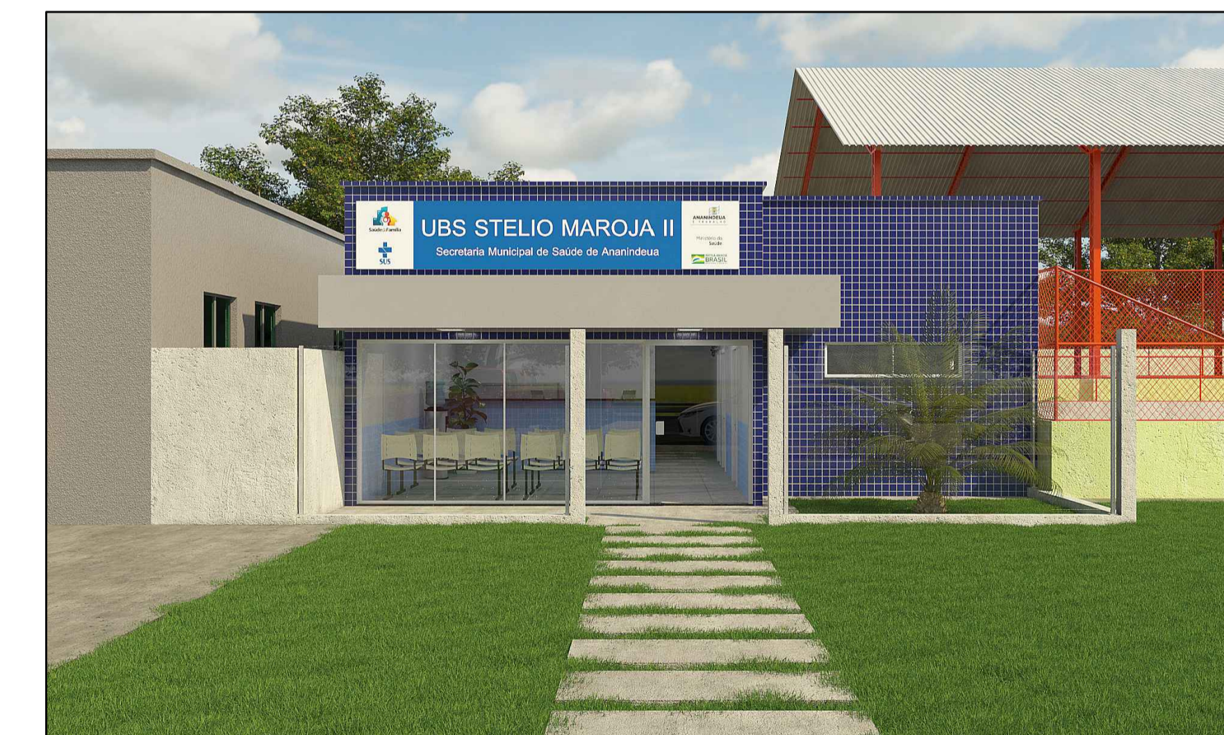
PERSPECTIVA S/ ESC.