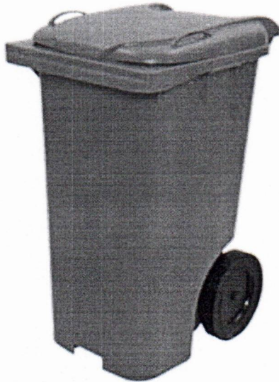
Modelo Carro coletor 120 e 240 litros

ESTADO DO PARÁ MUNICÍPIO DE ANANINDEUA PREFEITURA MUNICIPAL DE ANANINDEUA