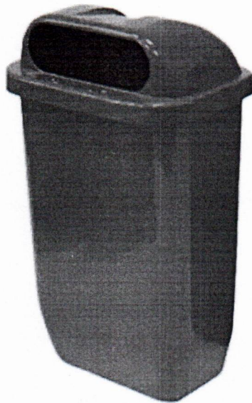
Modelo das Papeleiras

3.10.2- A Contratada deverá considerar a substituição das papeleiras e carros coletores instaladas a cada 2 anos.