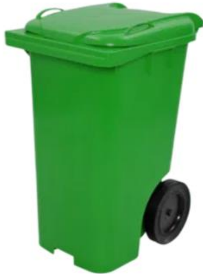
Modelo Carro coletor 120 e 240 litros

ESTADO DO PARÁ MUNICÍPIO DE ANANINDEUA PREFEITURA MUNICIPAL SECRETARIA MUNICIPAL DE LICITAÇÃO PROCESSO ADMINISTRATIVO Nº 24.002/2024- SEURB/PMA CONCORRÊNCIA ELETRÔNICA Nº 3/2024.024 SEURB/PMA