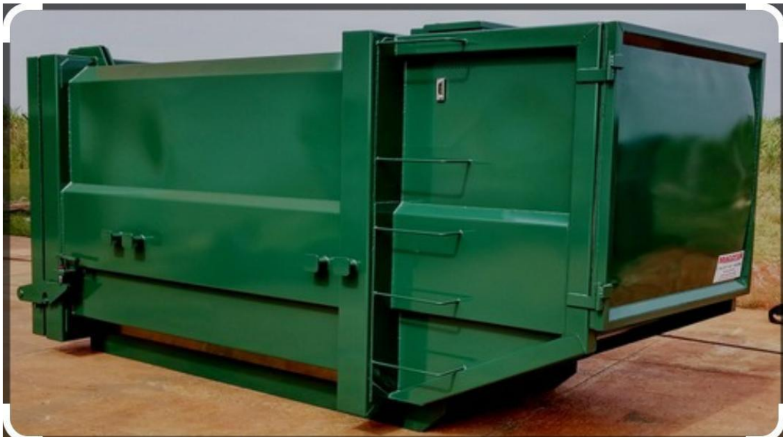
Modelo Coletor Estacionário