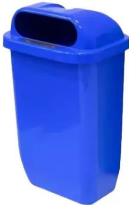
Modelo das Papeleiras

3.10.2- A Contratada deverá considerar a substituição das papeleiras e carros coletores instaladas a cada 2 anos.