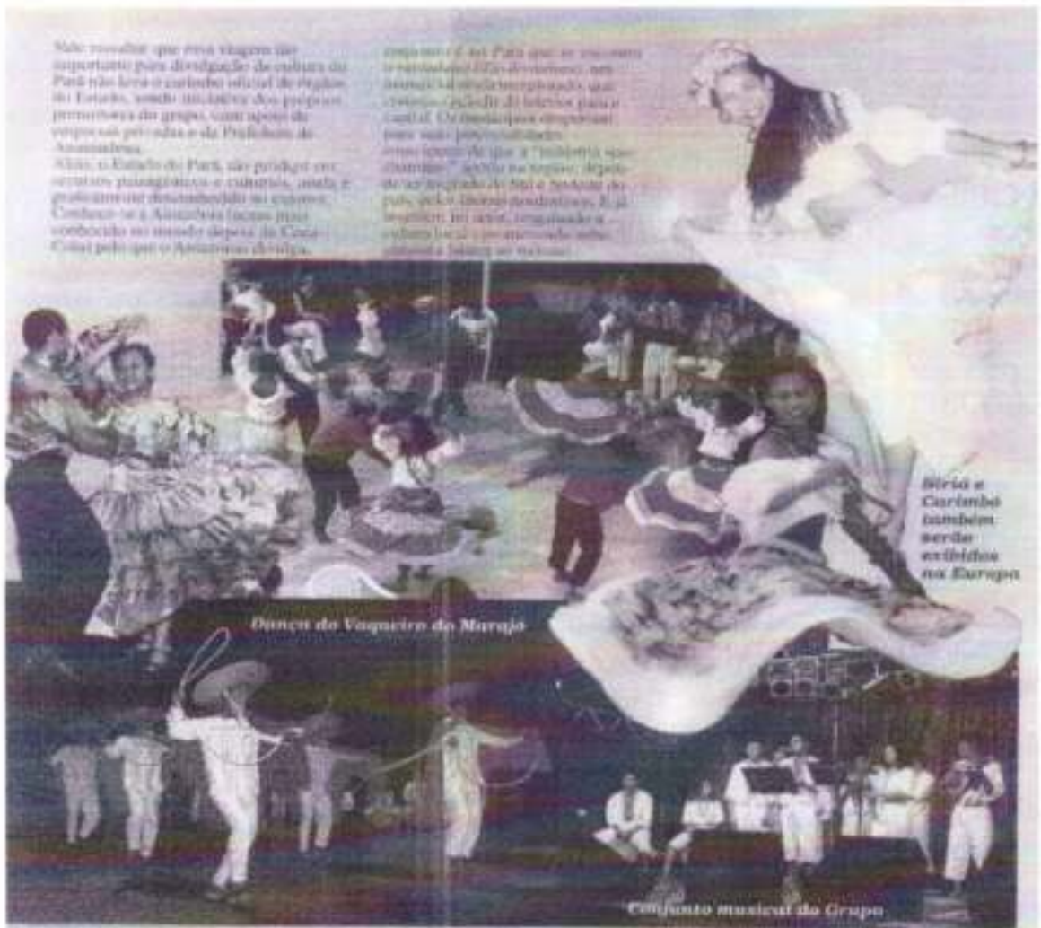
Birra e Carimbó também serão exibidos na Europa

compromisso do Pará que se encontra o patrimônio cultural do movimento, em áreas de desenvolvimento social, econômico e cultural. O objetivo para a cultura. O movimento organizacional para uma preservação do patrimônio cultural de que a "Instituto de Ananindeua" se encontra no setor, depois de ser integrado de 1981 e também de 1982, pela Prefeitura Municipal de Ananindeua. Em 1983, em 1984, inaugurando o setor de Ananindeua e também de Ananindeua no Brasil.