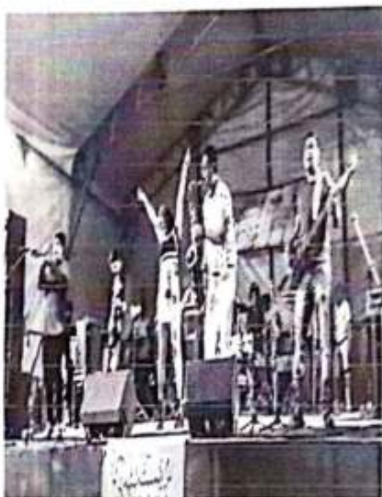
Réveillon em outeiro