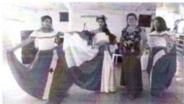
*Participação de Dançarinos convidados de Academias de Danças.