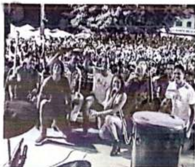
Réveillon em outeiro