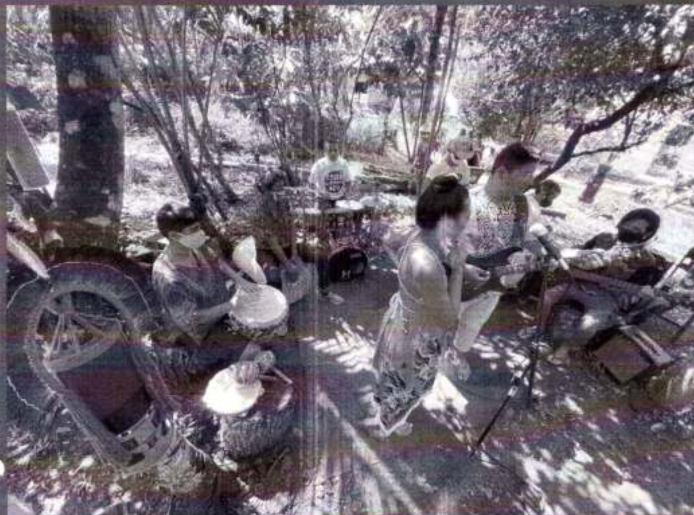
Gravação "É do Pará" (Tv Liberal)