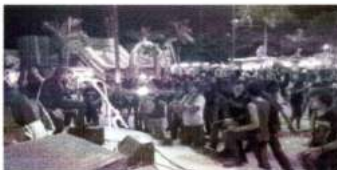
Imagem: A 7ª edição do festival junta o prazer de ouvir rock com a vontade de doar para salvar vidas.

Segunda, 20/02/2018 20h18 - Publicado em 20/02/2018 10h45 - de Oliveira