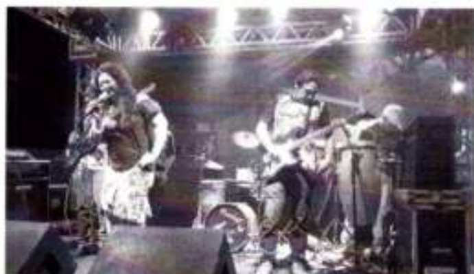
(Projeto Cantando no Interior- Salinas-Pa.)

Assim é nosso "Grupo Carimã", segue novas origens regionais e conta a origem desse processo musical em forma de canções: