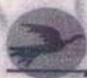
Conjunto musical do Grupo