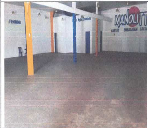
Vista do Salão