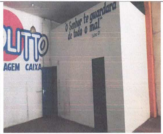
Vista da Entrada Banheiro