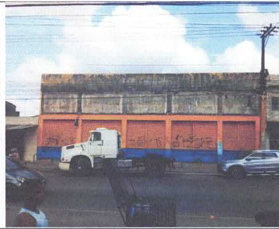
Vista de frente da fachada