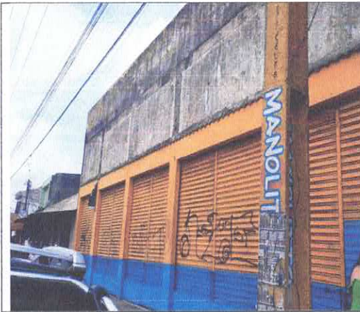
Vista da Fachada