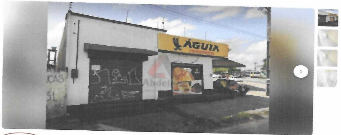
Imagem extraída de uma publicação em uma rede social