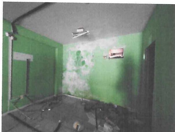
ESPAÇO DA GARAGEM E PÁTIO