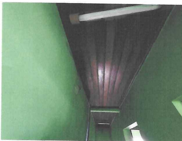
CIRCULAÇÃO PAVIMENTO SUPERIOR