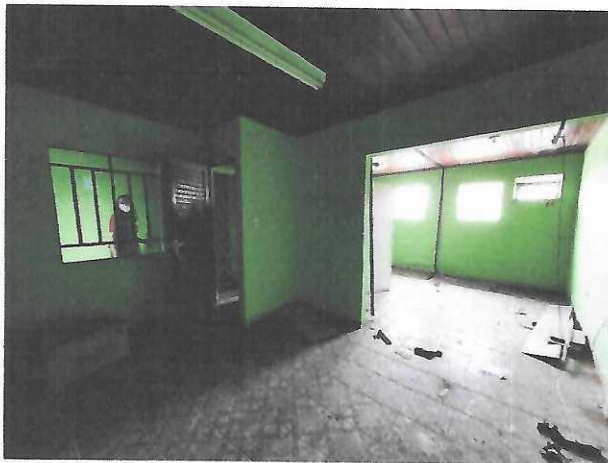
SALAS DO PAVIMENTO SUPERIOR