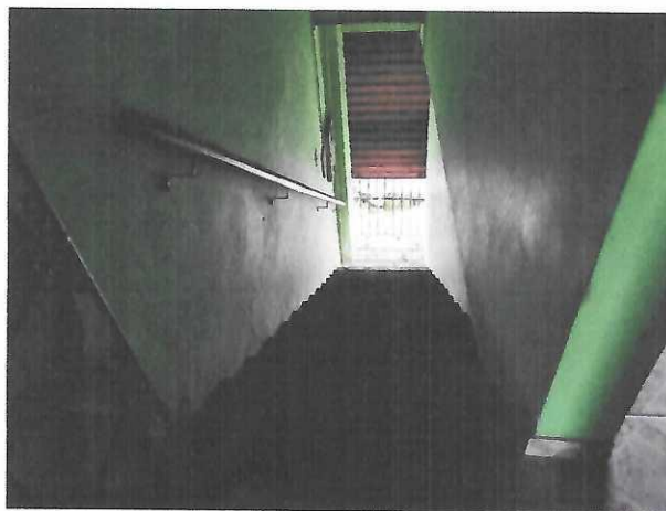
ESCALADA DE ACESSO AO PAVIMENTO SUPERIOR