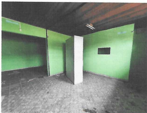
SALAS DO PAVIMENTO SUPERIOR