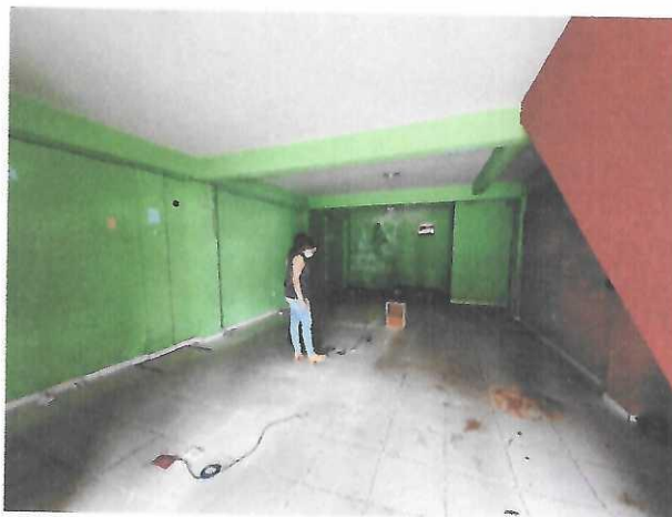
ESPAÇO DO TÉRREO