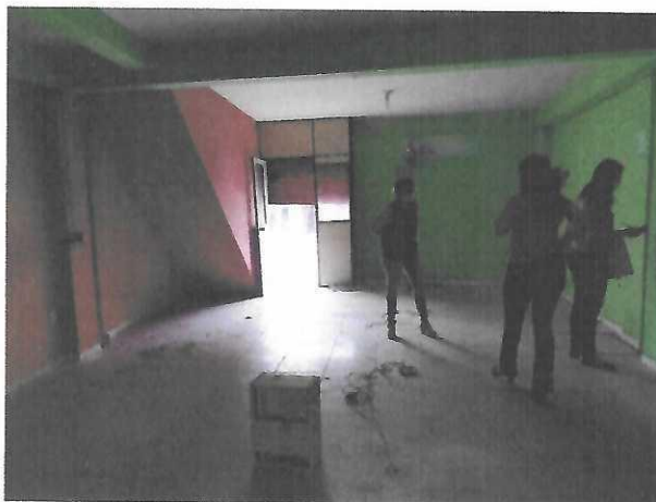
ESPAÇO INTERNO (SALÃO)